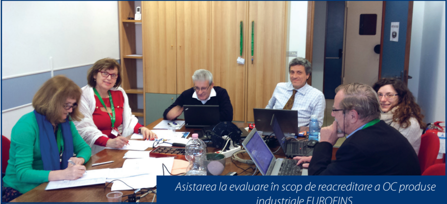
Asistarea la evaluare în scop de re acreditare a OC produse industriale EUROFINS.