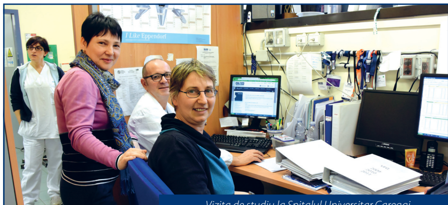
Vizita de studiu la Spitalul Universitar Careggi