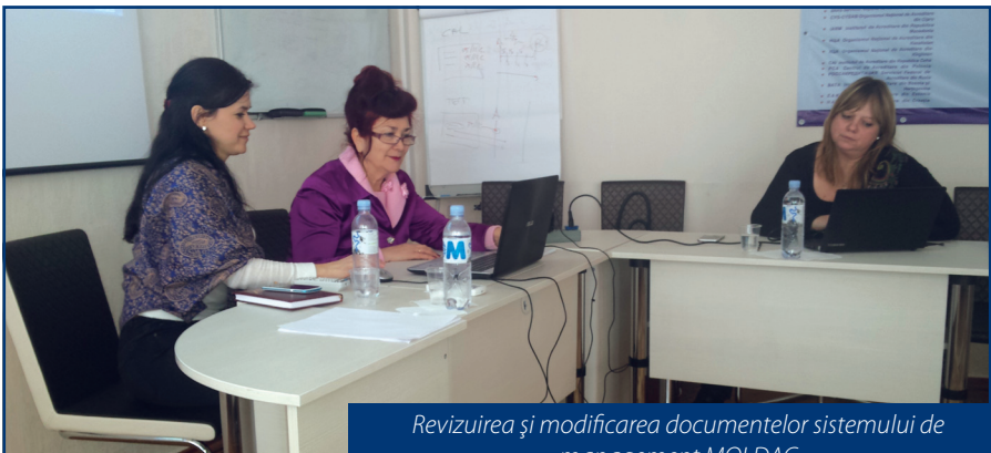
Revizuirea și modificarea documentelor sistemului de management MOLDAC