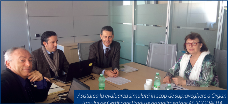
Asistarea la evaluarea simulată în scop de supraveghere a Organismului de Certificare Produse agroalimentare AGROQUALITA.