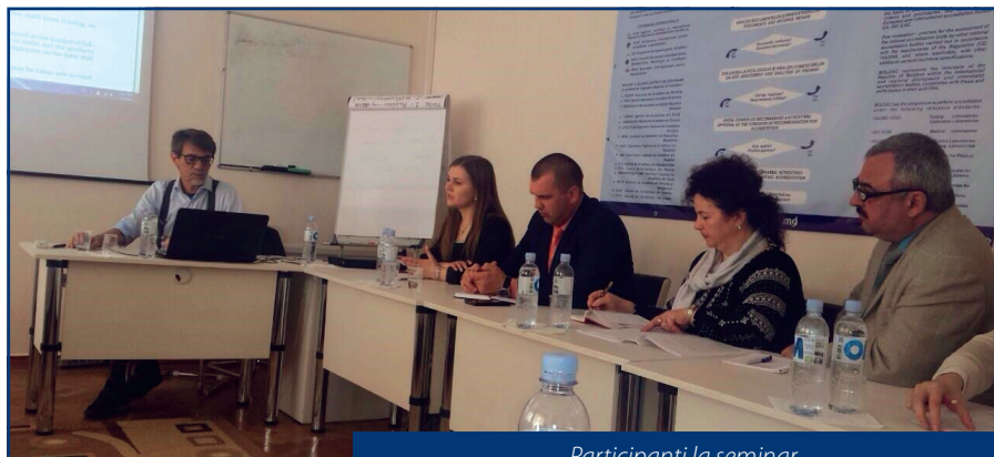
Participanți la seminar