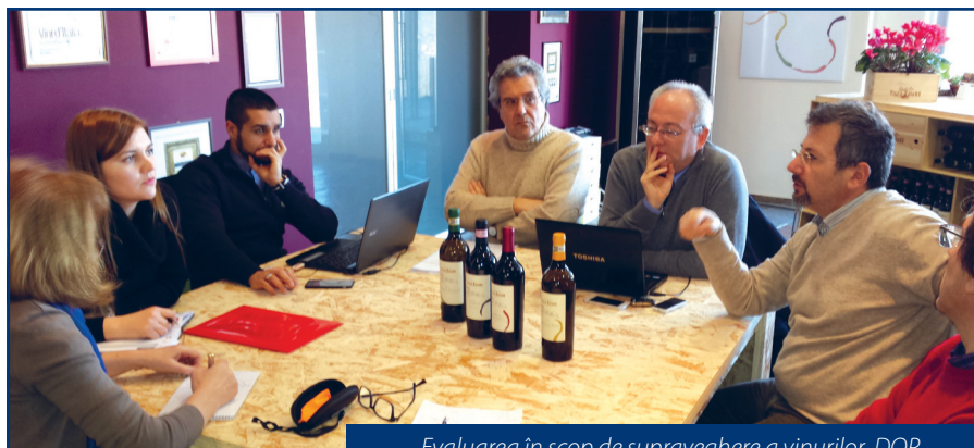
Evaluarea în scop de supraveghere a vinurilor DOP