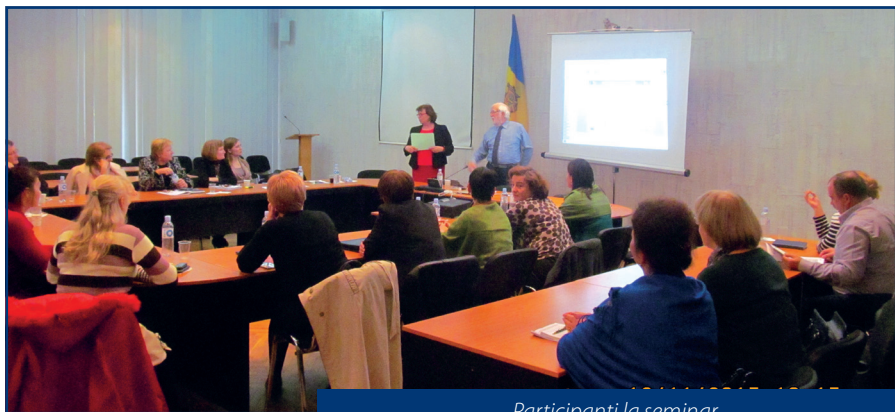
Participanți la seminar