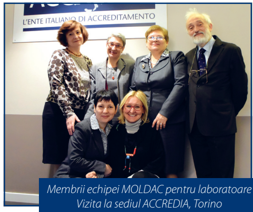
Membrii echipei MOLDAC pentru laboratoare Vizita la sediul ACCREDIA, Torino