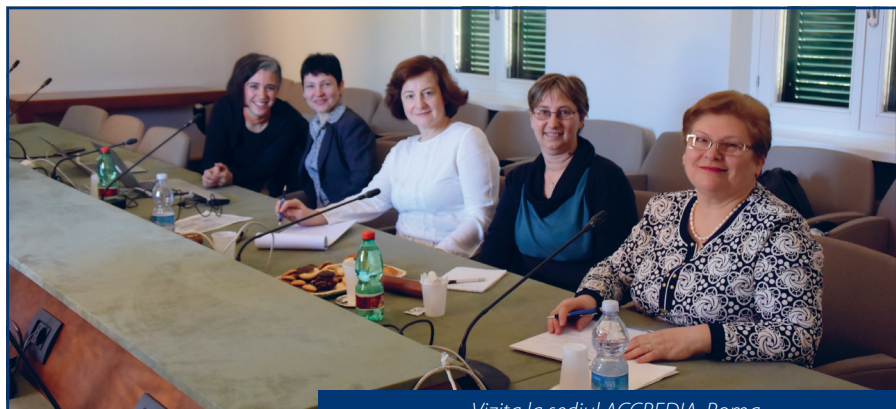
Vizita la sediul ACCREDIA, Roma