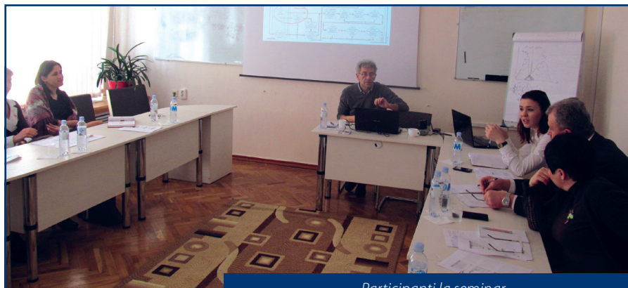
Participanți la seminar