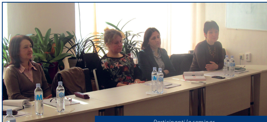
Participanți la seminar