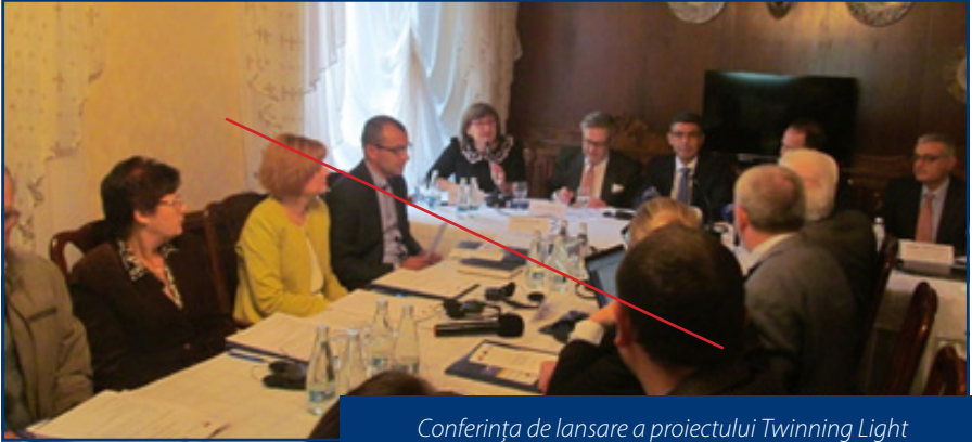
Conferința de lansare a proiectului Twinning Light